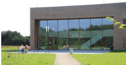
Gläserne Molkerei Dechow