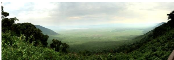
Ngorongoro-Krater in Tansania