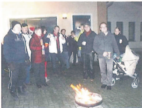
„Unser Grambow“ war Gastgeber am 19.12.

überall. Ich bin schon sehr gespannt, ob es auch in diesem Jahr wieder so viele freundliche Gastgeber geben wird. Ach so, genau wie im letzten Jahr, wollen wir unser winterliches Programm wieder mit einer fröhlichen Nachtwanderung im Grambow Moor fortsetzen. Lesen Sie dazu den Beitrag „Wanderung durch das nächtliche Moor“. Heike Weiberg