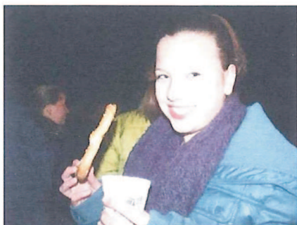
Die Brezeln waren köstlich ...

der der Besucher seine persönlichen Favoriten - gemütlich war es