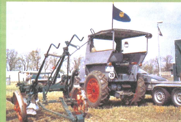
sehr fotogen zeigt sich dieser Schweriner RS03 „Aktivist“ mit seinem zweischaar Anhangepflug