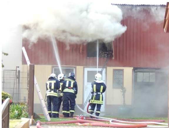
Unsere Kameraden beim Einsatz 2016 direkt in Grambow.

Wir haben noch Plätze frei. Macht mit! Grambow braucht dringend aktive Feuerwehrmitglieder.